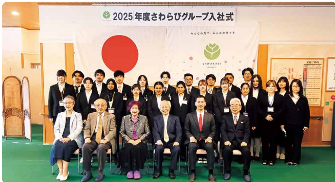
▲中列、後列が新人職員