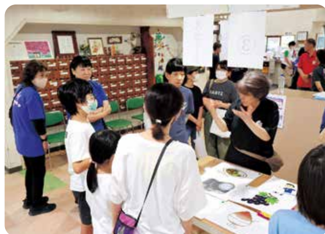
手話にチャレンジ!!